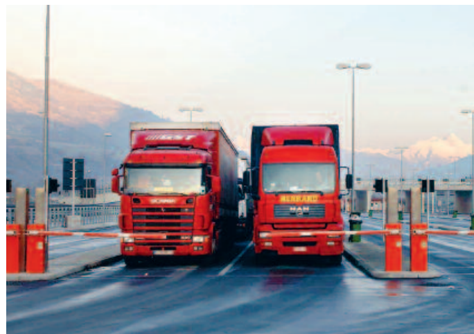
L'écotaxe sur les poids lourds pourrait être majorée de 15 à 25 % pour l'utilisation des routes de montagne.

Deux écoles s'affrontent quant aux modalités de mise en œuvre, selon qu'elle s'applique à un