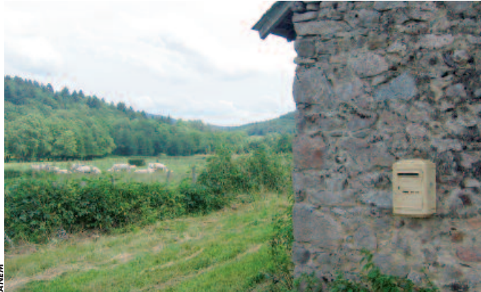
L'enjeu de la présence postale semble aujourd'hui s'être déplacé vers la qualité des prestations de levée et de distribution.

La loi du 20 mai 2005 relative à la régulation des activités postales prévoit une présence postale territoriale intégrant une dimension d'aménagement du territoire. Pour répondre à cet impératif, la même loi a prévu la constitution du fonds postal national de péréquation territoriale, qui voit enfin le jour. Il est essentiellement alimenté par l'abattement de fiscalité locale dont bénéficie La Poste.