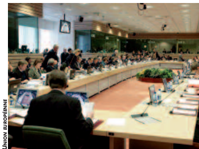
C'est maintenant aux membres du Conseil agricole d'alimenter le débat.

Les sommes ainsi épargnées seraient reversées au budget du développement rural, politique à travers laquelle les exploitations seront valorisées sous d'autres aspects que l'acte de production lui-même, notamment les mesures agro-environnementales.