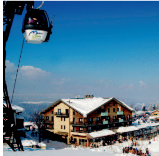
L'image des stations doit jouer à la fois sur la technicité des prestations et l'authenticité de l'identité locale.

mandations, exprimées ou formulées dans le rapport de l'association, devraient contribuer à la réflexion des groupes de travail censés préparer les assises du tourisme de montagne, annoncées pour le printemps 2008 (1) .