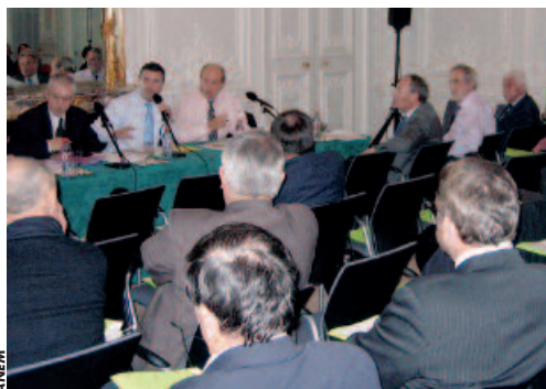
La réunion s'est tenue dans un des salons de l'hôtel de Pomereu, siège de la Caisse des dépôts.

hôpitaux, et celle avec le ministre de l'Education nationale, Xavier Darcos, le 28 novembre (voir le compte rendu dans PLM n° 178), s'agissant notamment de la relance des classes de découverte.