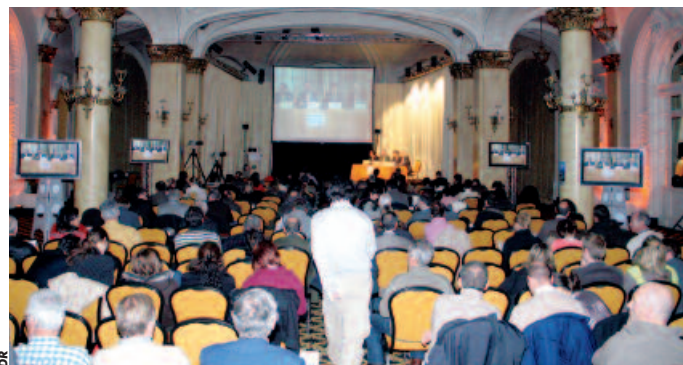
Comme c'est de tradition, le centre des congrès Le Majestic a accueilli les débats des 9 e Sommets du tourisme.

La désertification des stations par les jeunes ménages n'est pas propre à la France, comme l'a exposé Peter Ries, directeur général de l'office de tourisme de