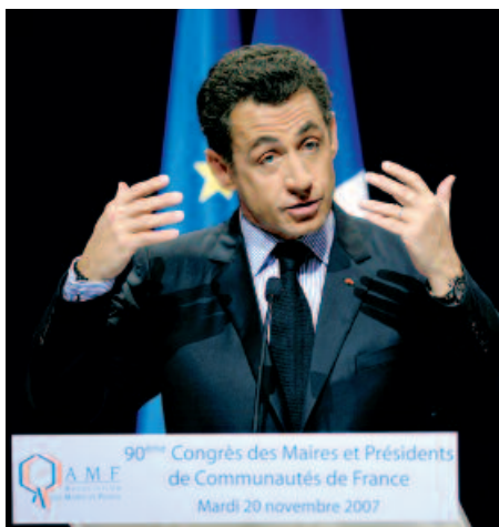
C'est devant le congrès des Maires de France que le président de la République a fait part de ses orientations pour réformer la fiscalité locale.

Nul doute que ces propositions nourriront la réflexion de la Conférence nationale des exécutifs, dont on rappelle, qu'installée par le Premier ministre le 4 octobre dernier, et présidée par celui-ci, elle est désormais le lieu de concertation au plus haut niveau entre le gouvernement et les exécutifs des collectivités territoriales.